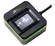
Requiere enrolador SLK20R

Los paneles de control de acceso de 1, 2 y 4 puertas con aplicación web incorporada eliminan el uso de un software de administración.